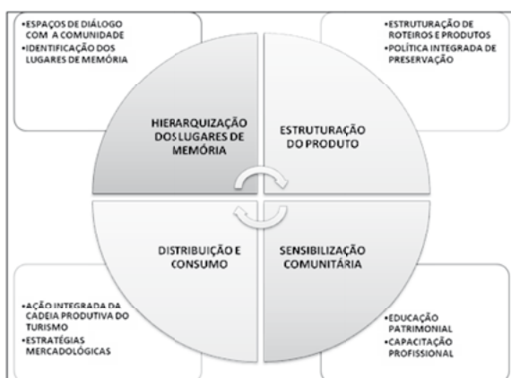
Figura 1 - Aplicação da categoria lugar de memória no planejamento turístico.

A tematização da oferta de produtos e serviços implica a utilização de uma metodologia compatível com a realidade social dos destinos urbanos, avaliando o nível de desenvolvimento turístico existente e identificando os espaços representativos da memória e da identidade local. Baseado nesse delineamento, um conjunto de ações integradas de sensibilização e participação da comunidade, valorização, promoção e comercialização dos produtos culturais devem ser consentidas na perspectiva de promover novas experiências aos visitantes, aliada às estratégias de interpretação do patrimônio cultural (Figura 1):